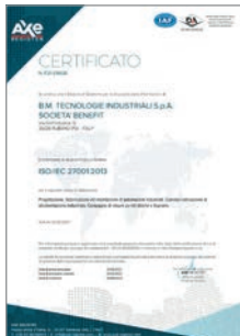
Certificazione ISO 27001:2013 Sistemi di gestione della sicurezza delle informazioni