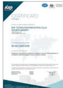
Certificazione ISO 50001:2018 Sistemi di gestione per l'energia