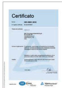
Certificazione UNI EN ISO 45001:2018 per la salute e la sicurezza sul luogo di lavoro