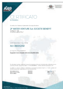
Certificazione ISO 39001:2012 Sistemi di gestione per la sicurezza stradale