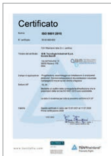
Certificazione UNI EN ISO 9001:2015 Sistema di gestione della qualità

Vogliamo fornire a tutti i nostri clienti il miglior servizio possibile e, al contempo, siamo fortemente impegnati nel valorizzare al massimo i nostri collaboratori. Per questo siamo convinti che un'attenta politica delle certificazioni rivesta un ruolo strategico fondamentale per lo sviluppo aziendale, rappresentando uno straordinario strumento di condivisione dei processi e offrendo una sicura garanzia dell'affidabilità delle procedure aziendali. Il sistema integrato della qualità rappresenta per noi un punto fondamentale del nostro operato ed è strutturato sulle seguenti certificazioni: