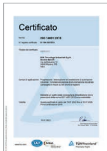
Certificazione UNI EN ISO 14001:2015 Sistema di gestione ambientale