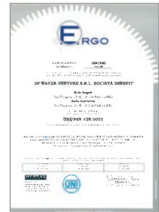
Certificazione UNI/PdR 125:2022 Parità di genere