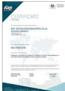
Certificazione ISO 37001:2016 Sistemi di gestione per la prevenzione della corruzione