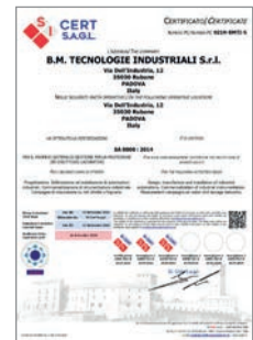
Certificazione SA8000:2014 per la responsabilità sociale